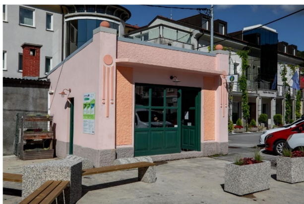
19. slika: zunanost čevljarske delavnice

Pokrajinski muzej Koper, enota Ilirska Bistrica, v sodelovanju z lokalnimi ustanovami pripravlja različne izobraževalne programe za predšolske in šolske skupine. Mlajšim obiskovalcem pripovedujejo pravljice, povezane s čevlji, in organizirajo ustvarjalne delavnice, medtem ko starejše skupine lahko sešijejo svoje copatke.