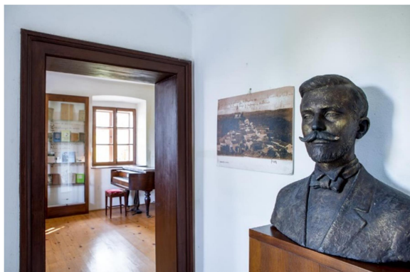
12. slika: Kettejeva spominska soba

Spominska soba se nahaja na naslovu Prem 83, 6255 Prem, Slovenija. Obisk spominske sobe Dragotina Ketteja ponuja vpogled v življenje enega najpomembnejših slovenskih pesnikov in predstavlja dragocen del kulturne dediščine Ilirske Bistrice.