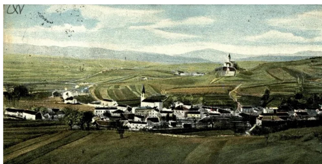
5.slika: Ilirska Bistrica leta 1900