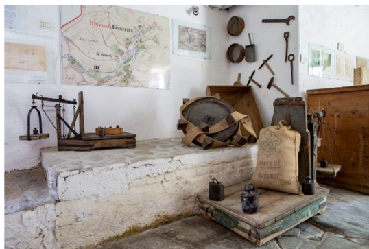
23.slika: Pripomočki mlina