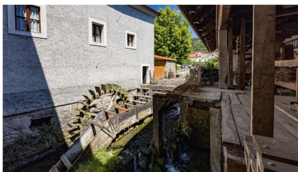
22.slika: Mlinsko kolo Hodnikovega mlina