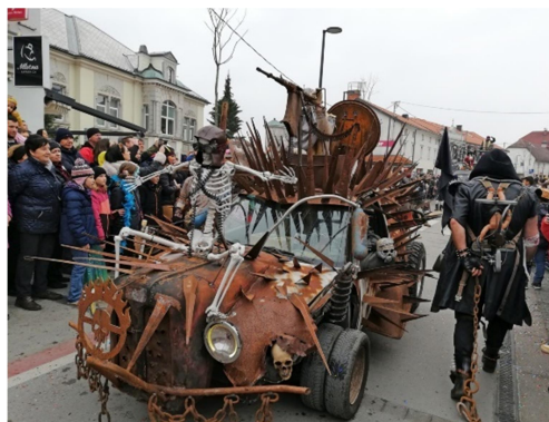
9.slika: Pust je pršu 2023 (Mad Max)