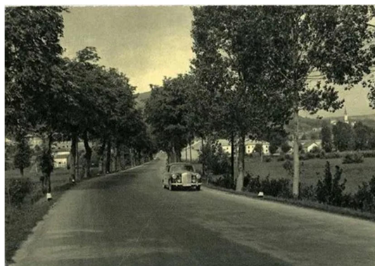
7. slika: Ilirska Bistrica leta 1962