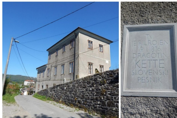
13. slika: Zunanost Kettejeve rojstne hiše