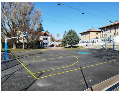
16.slika: Košarkarsko igrišče v parku Nade Žagar

Park Nade Žagar se nahaja v središču Ilirske Bistrice, v neposredni bližini občinske stavbe. Njegova dostopnost in raznolika ponudba ga uvrščata med priljubljene destinacije za prebivalce in obiskovalce mesta.