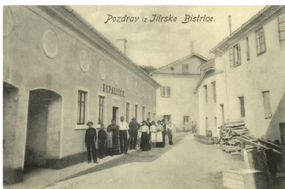
6.slika: Življenje v Ilirski Bistrici (1905)