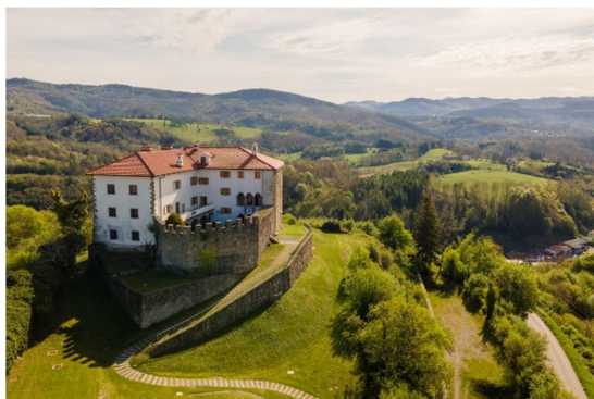
10.slika: Grad prem

Grad Prem se nahaja na slemenu nad reko Reko, na obrobju Brkinov. Za obiskovalce je dostopen z avtomobilom, parkirišče pa je na voljo v bližini gradu. Grad Prem je idealna destinacija za ljubitelje zgodovine, arhitekture in narave ter ponuja nepozabno doživetje za vse generacije.