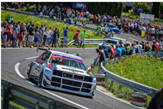
8.slika: 30. Gorsko-hitrostna dirka Ilirska Bistrica

2023 je Ilirska Bistrica tik pred glavno dirko profesionalnih kolesarjev organizirana ulična pony dirka. Tekmovanje običajno vključuje različne kategorije, od rekreativnih do šaljivih, z namenom spodbujanja, druženja gibanja in dobre volje. V ospredju ni zmaga, temveč zabava, smeh in obujanje spominov.