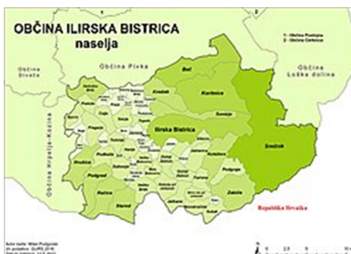
3.slika: Občine Ilirske Bistrice