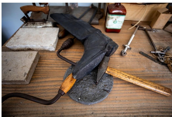
20.slika: še ohranjeni pripomočki Ludvika Peršeta