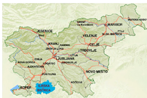
2.slika: Ilirska Bistrica na karti Slovenije