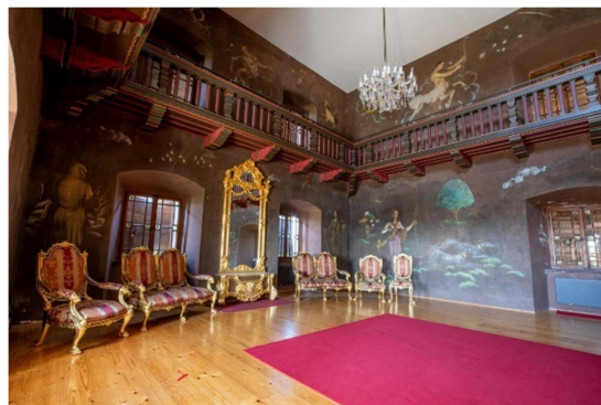
11. slika: interier gradu Prem