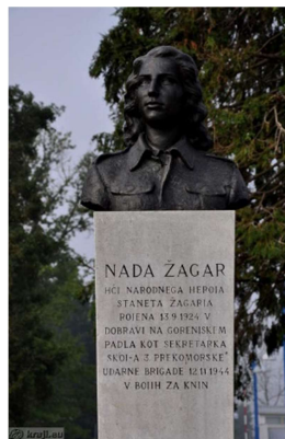
17.slika: spomenik Nade Žagar