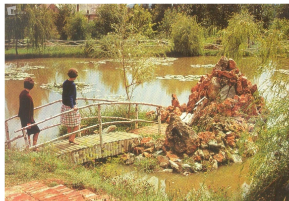
15. slika: Razglednica Kindlerjevega parka (1966)