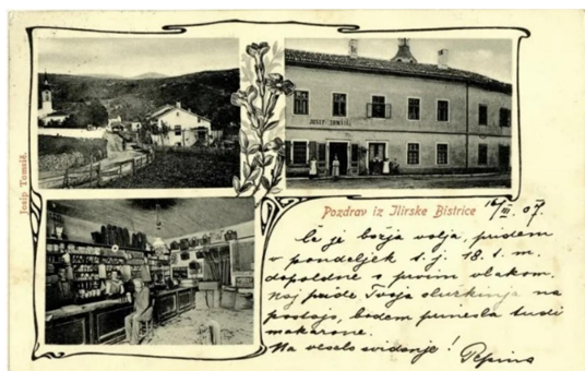
4.slika: Razglednica iz Ilirske Bistrice (1907)

Ilirska Bistrica ima tudi dolgo in bogato športno tradicijo, kar potrjujejo številna športna društva. Med najbolj priljubljenimi športi sta že dolgo časa nogomet in košarka. Današnji neverjeten dosežek v športu je, da so v šestdesetih letih prejšnjega stoletja eno sezono košarkaši Ilirske Bistrice igrali v prvi jugoslovanski košarkarski ligi. Med druge priljubljene športe sodijo tudi rokomet, balinanje in lokostrelstvo itd. Zelo poznana pa je Gorsko-hitrostna dirka na Šembije in odmevna vsakoletna prireditve v Il. Bistrici, saj privabi gledalce iz vse Slovenije pa tudi iz tujine.