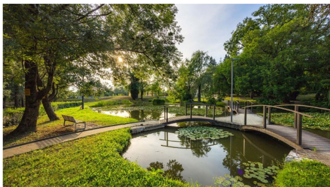
14.slika: Kindlerjev park

Park je odprt skozi vse leto in ponuja različne izkušnje glede na letni čas. Spomladi cvetijo prve grmovnice, poleti park oživi z bujno vegetacijo, jeseni očara s pisanimi listi, pozimi pa s svojo tišino in zelenimi iglavci.