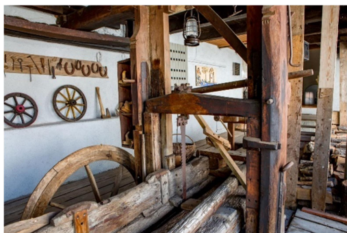
21.slika: Žaga na Hodnikovem mlinu

Hodnikov mlin se nahaja na Trgu maršala Tita 6 v Ilirski Bistrici. Hodnikov mlin je pomemben del tehniške in kulturne dediščine Ilirske Bistrice ter ponuja edinstven vpogled v preteklost mlinarstva in žagarstva v regiji.