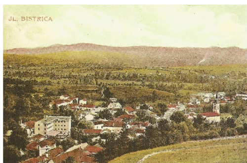
1.slika: Razglednica Ilirske Bistrice iz 1910

Ilirska Bistrica se danes ponaša z neokrnjeno naravo, kraškimi pojavi, gozdovi ter bližino Snežnika. Vse to ponuja možnosti za razvoj turizma in rekreacije. Gospodarstvo temelji na industriji, kmetijstvu ter vse bolj tudi na trajnostnem razvoju.